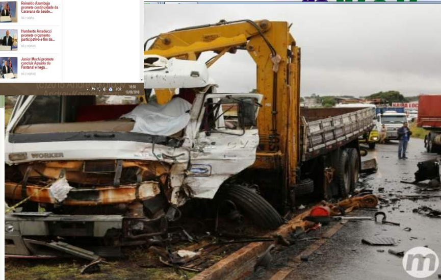
Acidente mata caminhoneiro

Veja Mais Morre operário que ficou soterrado em obra de rede de esgoto